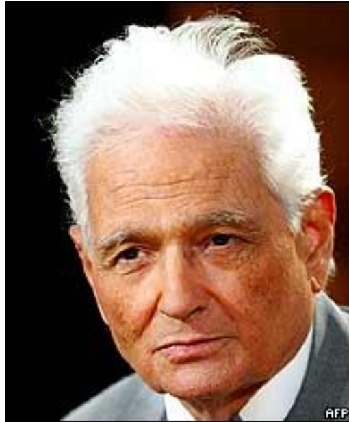
Jacques Derrida (1930-2004)

C'est au moment du "je ne sais pas quelle est la bonne règle" que la question éthique se pose. (...) Ce moment où je ne sais pas quoi faire, où je n'ai pas de normes disponibles, où je ne dois pas avoir de normes disponibles, mais où il faut agir, assumer mes responsabilités, prendre parti.