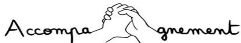
"Illustration © Laure Chareyre"